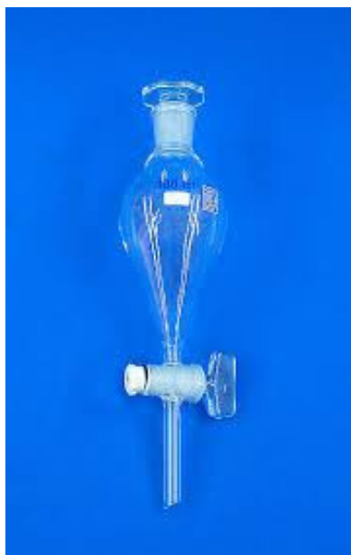
LIJEVAK ZA ODJELJIVANJE