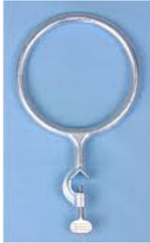
METALNI PRSTEN S MUFOM