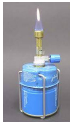
PLAMENIK (S UKAPLJENIM PLINOM)