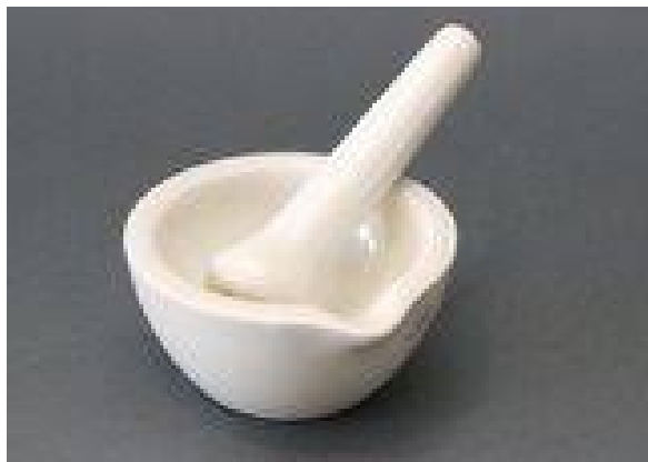
TARIONIK S TUIČKOM