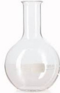
OKRUGLA TIKVICA S RAVNIM DNOM