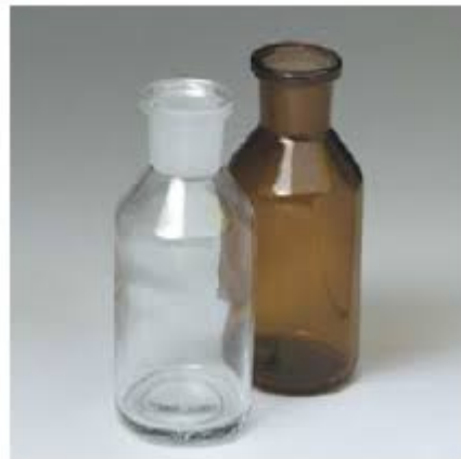
BOCE ZA ČUVANJE KEMIKALIJA