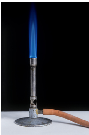
PLAMENIK (BUNSENOV P.)