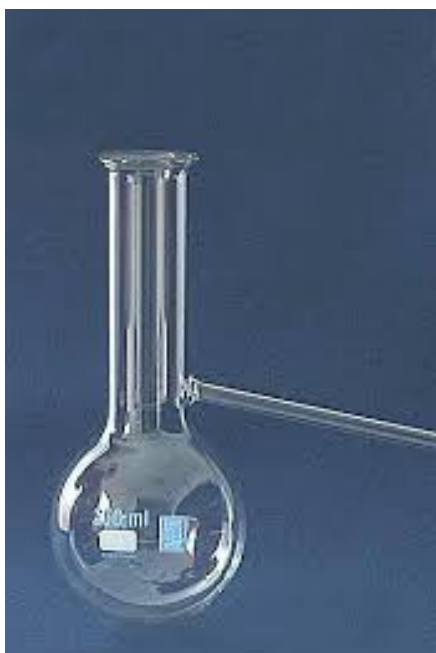
TIKVICA ZA DESTILACIJU