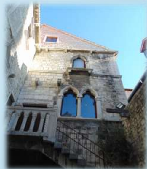
Papalićeva palača - okupljalište splitskih književnika i humanista