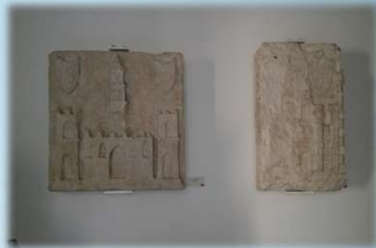
Grb grada Splita iz 15. st.