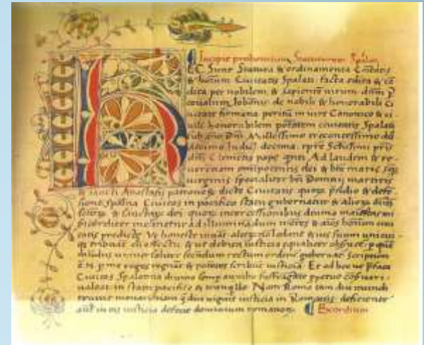
Prva stranica statuta iz 1312. god.

Predstavlja vrhunski društveni spomenik demokratskih komunalnih propisa građana Splita, koji im je jamčio slobodan život i rad.