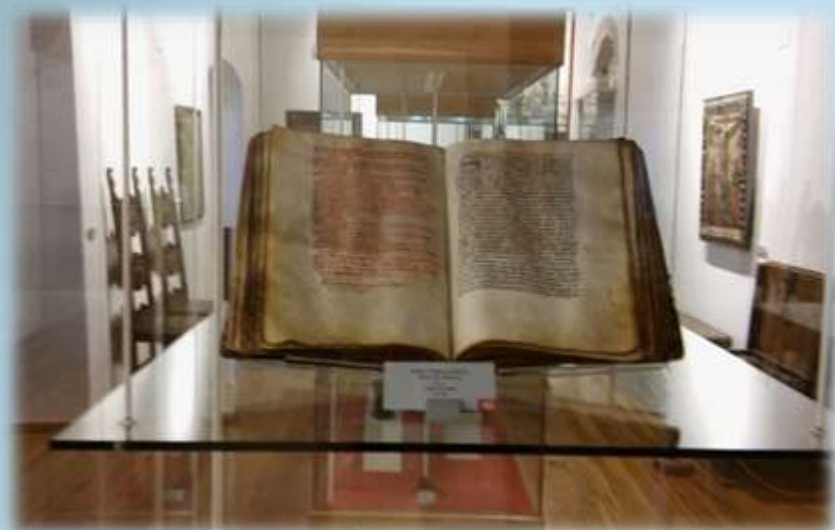
Statut grada Splita iz 1395. god.