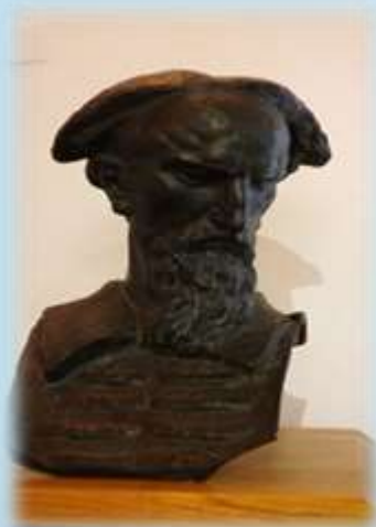
Marko Marulić - izradio Ivan Meštrović 1924.g - bronca