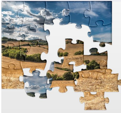
Primjer 1. https://tinyurl.com/brezuljak

Učenici rade na tabletima i slažu slagalicu. Fotografija koju slažu prikazuje brežuljkasti zavičaj.